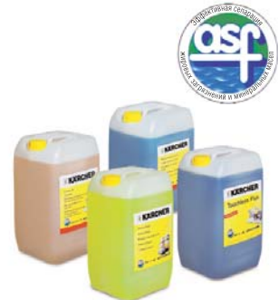
Чистящие средства для водоподготовки