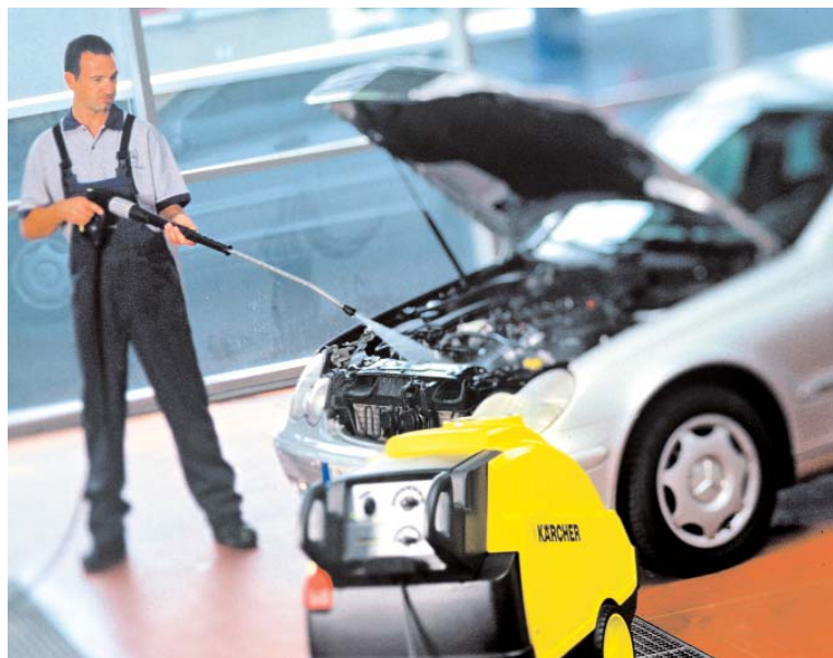
• Мойка двигателей высоким давлением

На всех участках применения аппаратов высокого давления для очистки двигателей, днищ автомобилей и крупногабаритных деталей встает вопрос обработки загрязненных маслами сточных вод, гарантирующей соблюдение требований экологического законодательства.