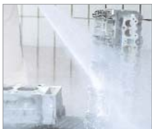
• Очистка крупногабаритных деталей высоким давлением