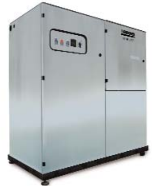
Исполнение в корпусе из нержавеющей стали