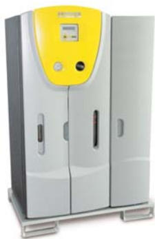
WTC 600 Высококачественная установка подготовки питьевой воды