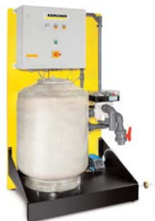
ARS Установка для рентабельной регенерации сточных вод автомобильных моечных установок