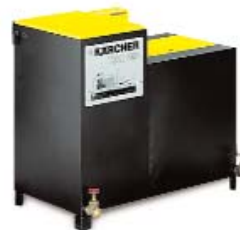
HDR 555 Установка регенерации и подготовки сточных вод, образующихся при мойке автомобилей аппаратами высокого давления