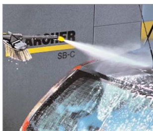
• Мойка поверхностей высоким давлением