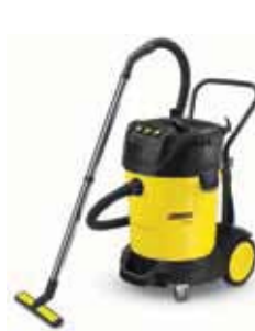
NT 70/3 Специальная цена!