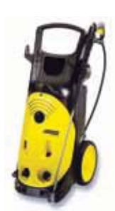
HD 10/23-4S Специальная цена!