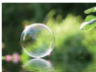
Охрана окружающей среды