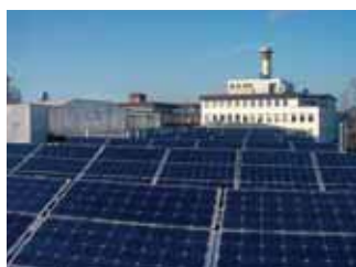
Использование собственных источников

В стремлении к устойчивому развитию сам путь уже является целью. Это – путь в будущее, по которому Kärcher ступает с достойным подражания постоянством на протяжении нескольких десятилетий, опираясь на принципы экономии, социальной ответственности и охраны окружающей среды. Солидный капитал и стабильная прибыль, достигнутые при уважительном обхождении с людьми и бережном обращении с ресурсами – все это результат предпринимательской деятельности, базирующейся на ответственности перед человеком и окружающей средой.