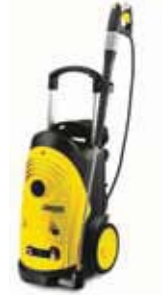
HD 6/16-4M Специальная цена!