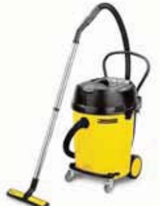
NT 65/2 Ap Специальная цена!