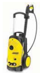
HD 6/15 C Специальная цена!