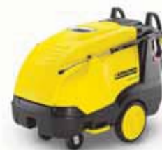
HDS 8/18-4M Специальная цена!