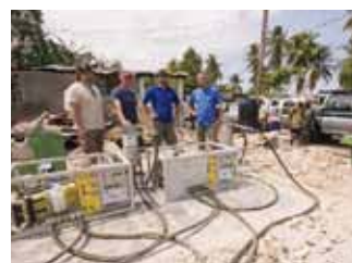
Ответственное отношение к людям