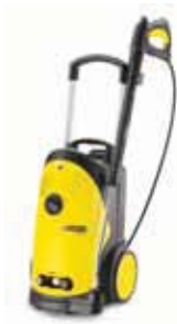
HD 5/12 C Специальная цена!