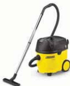
NT 35/1 Ap Специальная цена!