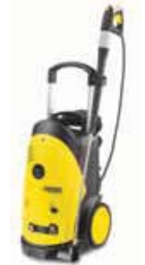
HD 9/20-4 M Специальная цена!