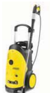
HD 7/18-4M Специальная цена!