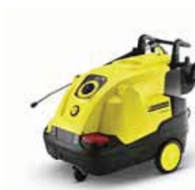
HDS 6/14 C Специальная цена!