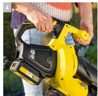
4 Двуручный захват