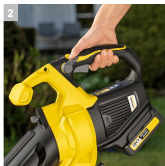
2 Переменная регулировка скорости