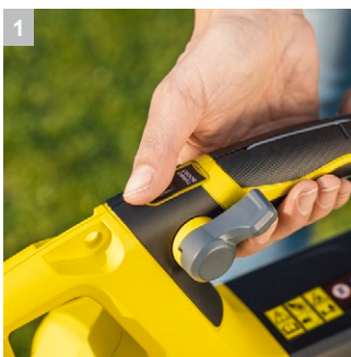
1 Turbo Boost