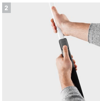
2 Удобное изменение рабочей длины