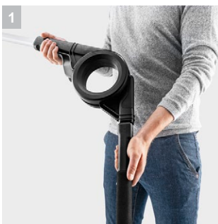
1 Регулируемый шарнир

Комплект, состоящий из телескопической струйной трубки TLA 4 и насадки для мойки фасадов и стекол, предназначен для легкой очистки объектов с труднодоступными поверхностями, например фасадов домов или зимних садов.