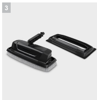
3 С насадкой для мойки фасадов и стекол