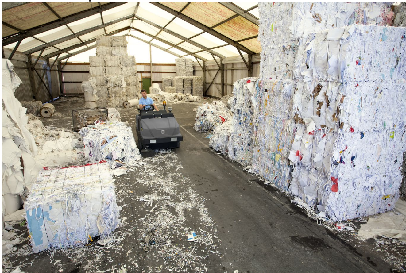
KM 130/300 R D Classic

■ Высокая рабочая скорость и скорость транспортировки