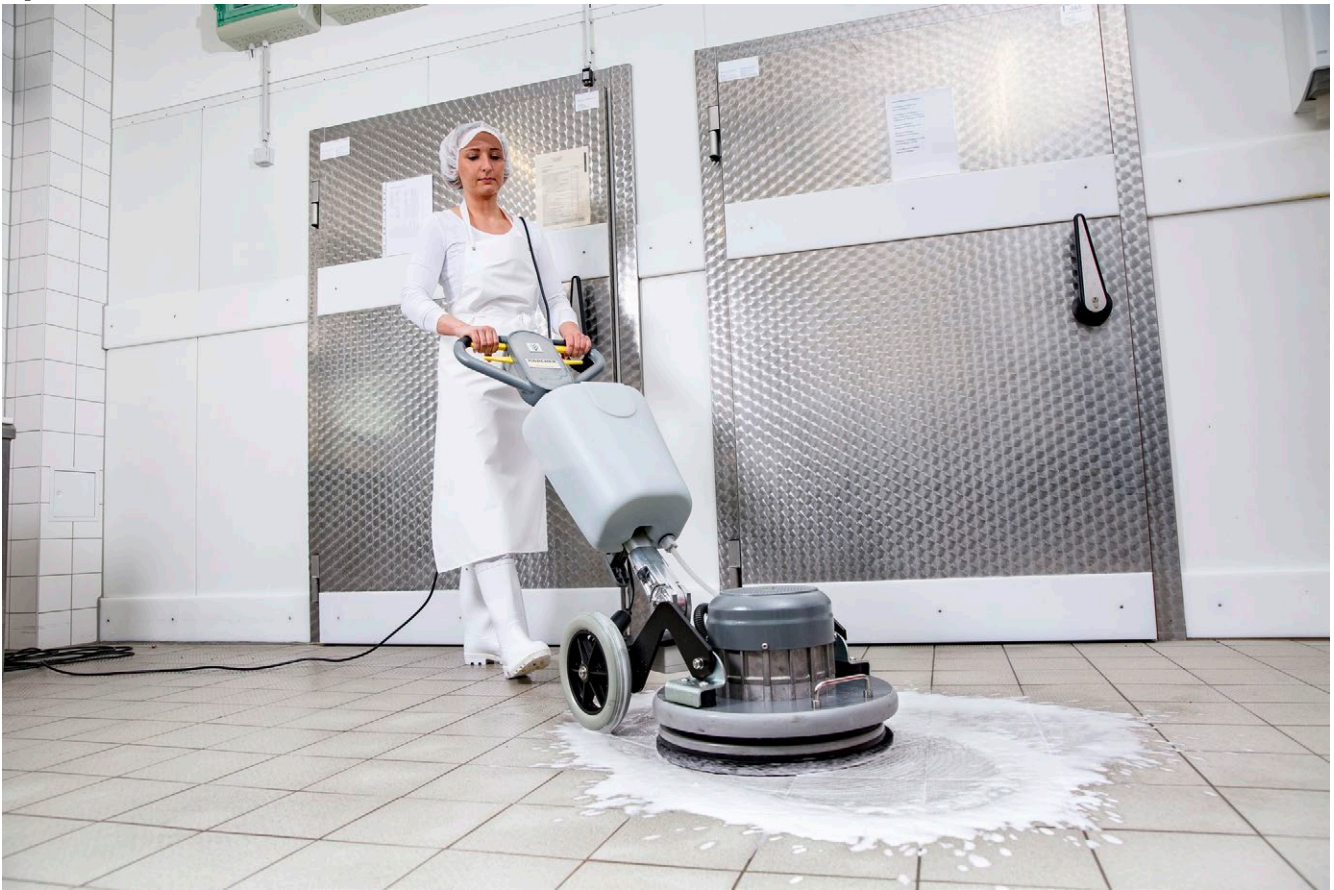
BDS 43/ Orbital C Поломочная машина.