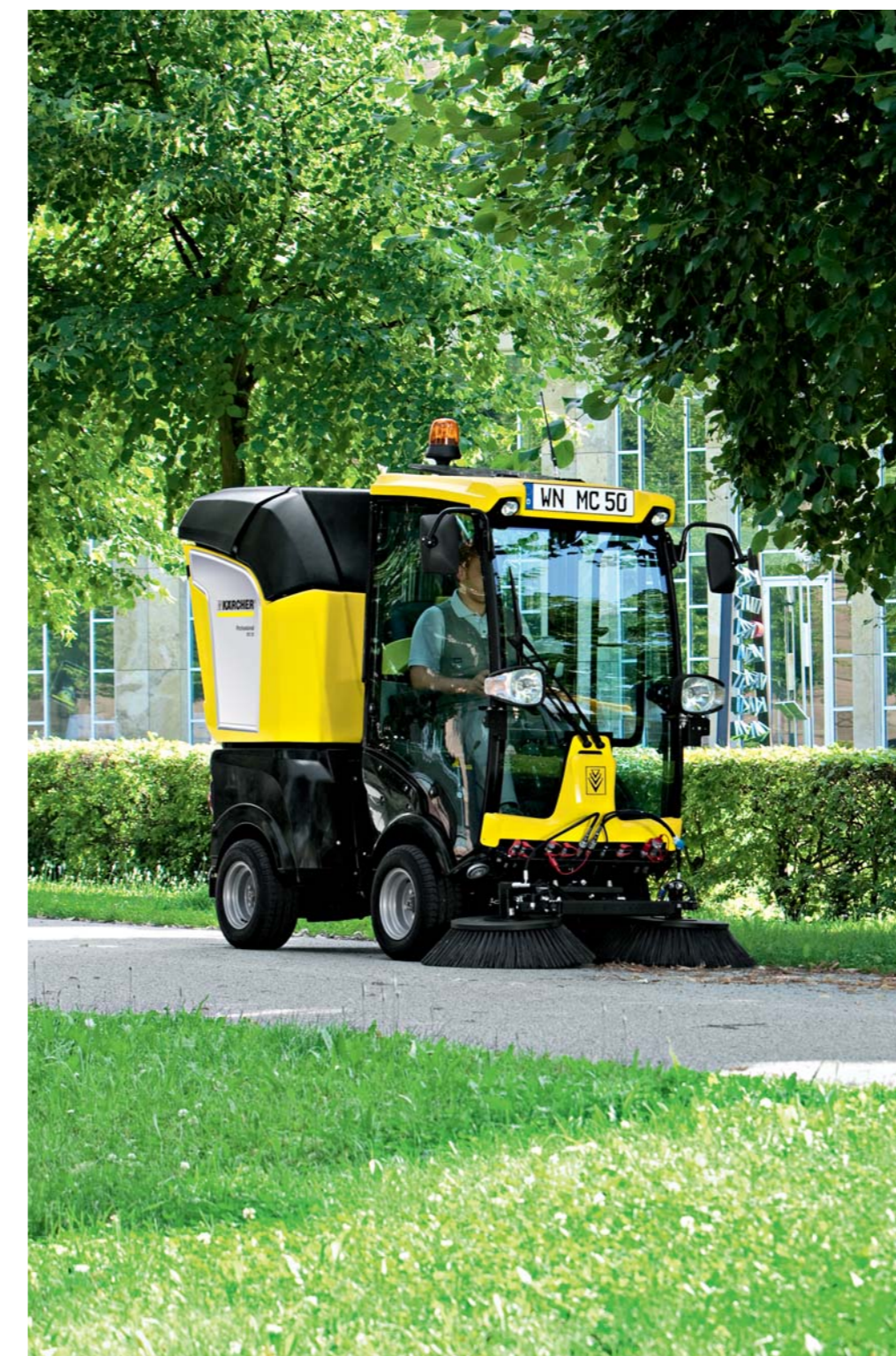
Рис. - 12/2009 - Номер для заказа 0.015-929 - Отпечатано в Германии на бумаге, не содержащей хлора. Возможны точечные изменения.

Чистота, оперативность и эффективность в сочетании с высочайшей маневренностью