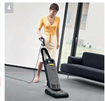
4 Запатентованная центробежная муфта