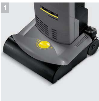
1 Ручная регулировка роликовой щетки

Профессиональный щеточный одномоторный пылесос CV 30/1 - оснащен интегрированной цилиндрической щеткой в дополнение к всасывающей турбине. Благодаря этому обеспечиваются отделение от коврового ворса налипших частиц грязи, нитей или волос и одновременное его прочесывание. Данная модель незаменима для оперативной уборки помещений с преобладанием ковровых покрытий таких как гостиницы, офисы, кинотеатры и пр. муниципальные учреждения.