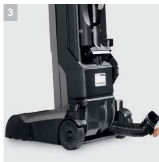
3 Превосходная чистка