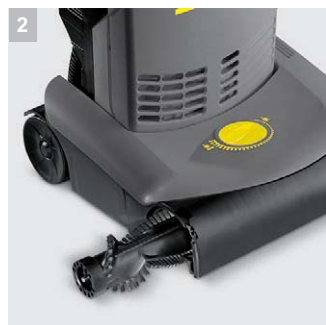
2 Простая замена щеток